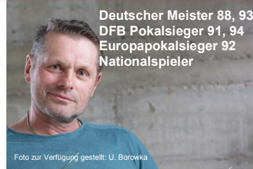
Deutscher Meister 88, 93 DFB Pokalsieger 91, 94 Europapokalsieger 92 Nationalspieler